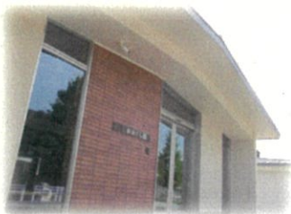
生活支援第四部 （はちくら園）