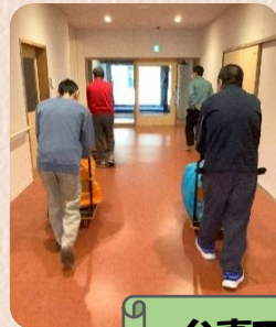
台車で運び、各係へ届ける