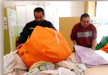
袋からタオルを出し、たたむ

昨年4月から取り組んできたランドリー作業では、各利用者様できることが増え、成長を感じられた一年でした。