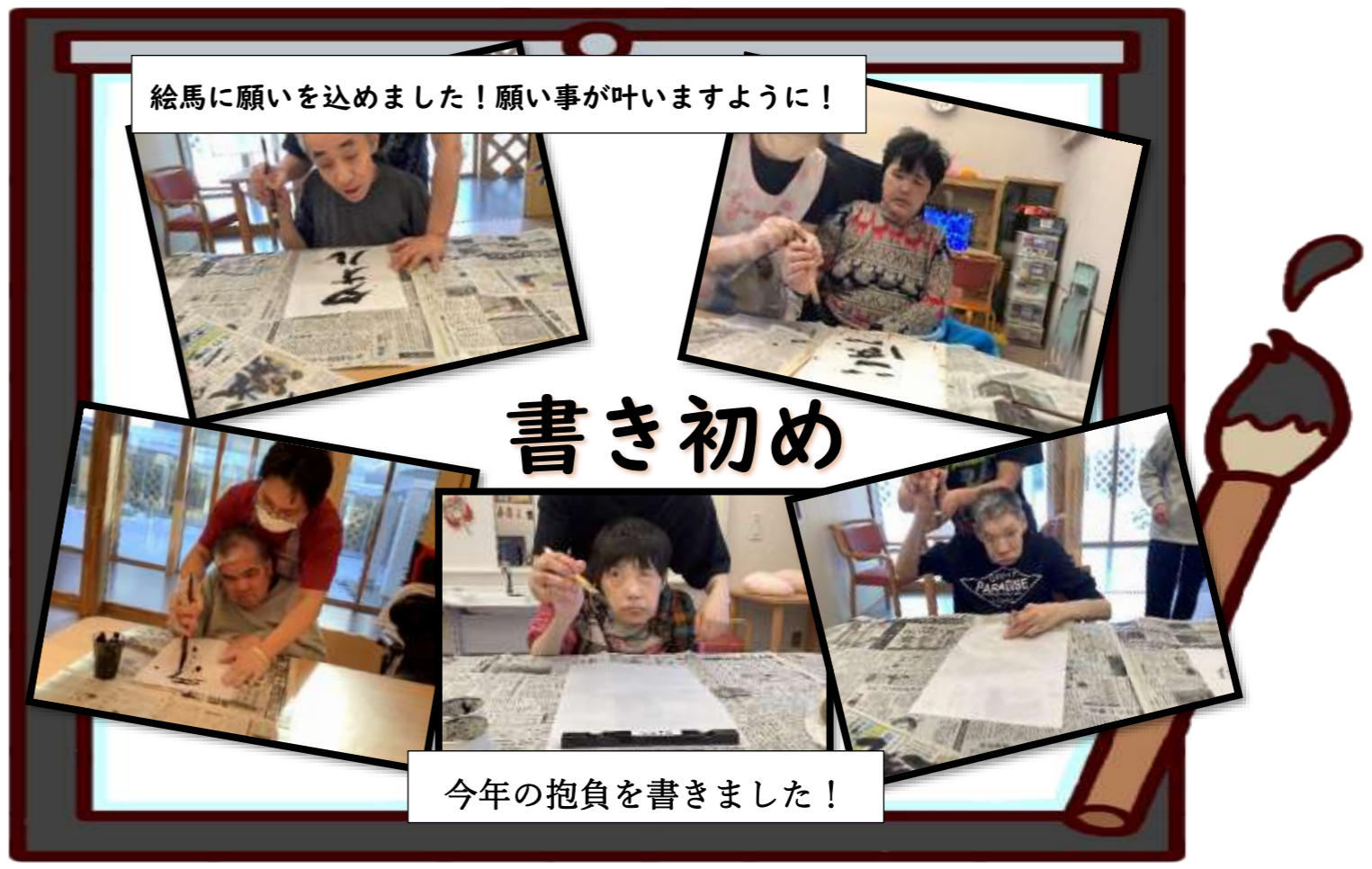
絵馬に願いを込めました! 願い事が叶いますように!