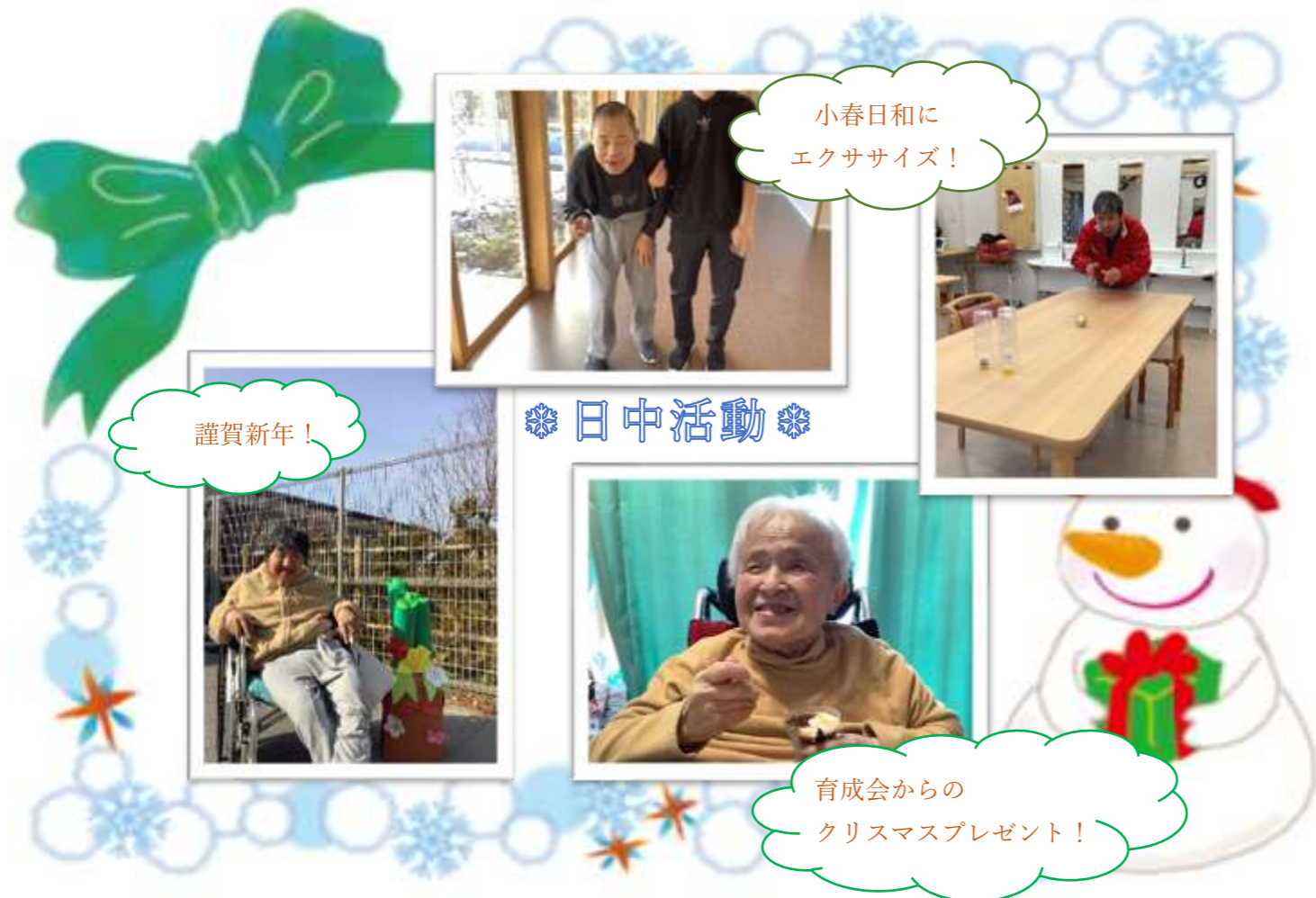
小春日和に エクササイズ!