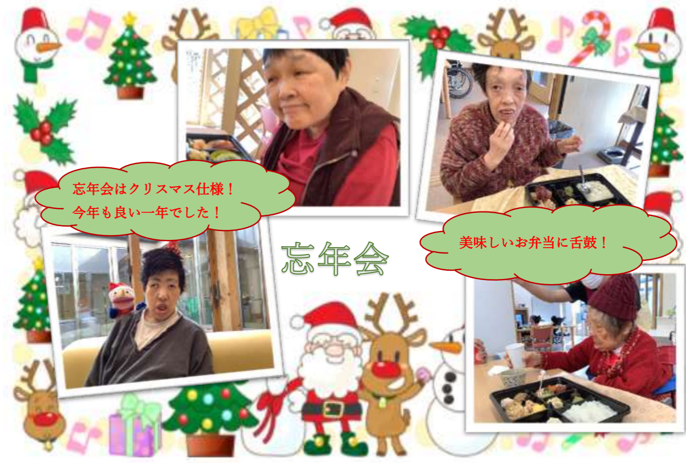
忘年会はクリスマス仕様! 今年も良い一年でした!