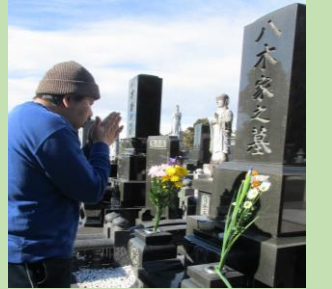
ふるさと訪問を行いました。