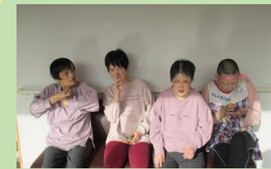
みんなで日向ぼっこ！ ウトウト…