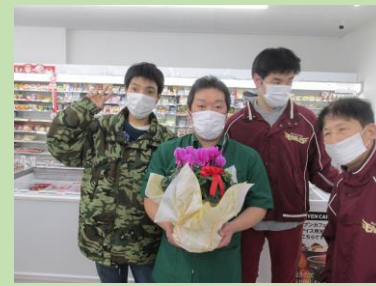
日頃の感謝を込めてシクラメンをお贈りしました！