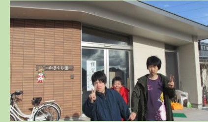
新年、初写真でピース！