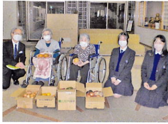
利用者様との記念撮影。

令和5年10月、宮城学院女子中高等学校の先生と生徒様が来園され、収穫された野菜をご寄付いただきました。