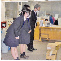
先生、生徒様が来園し、大収穫です！たくさんのご寄付いただきました。自然の恵みに感謝。