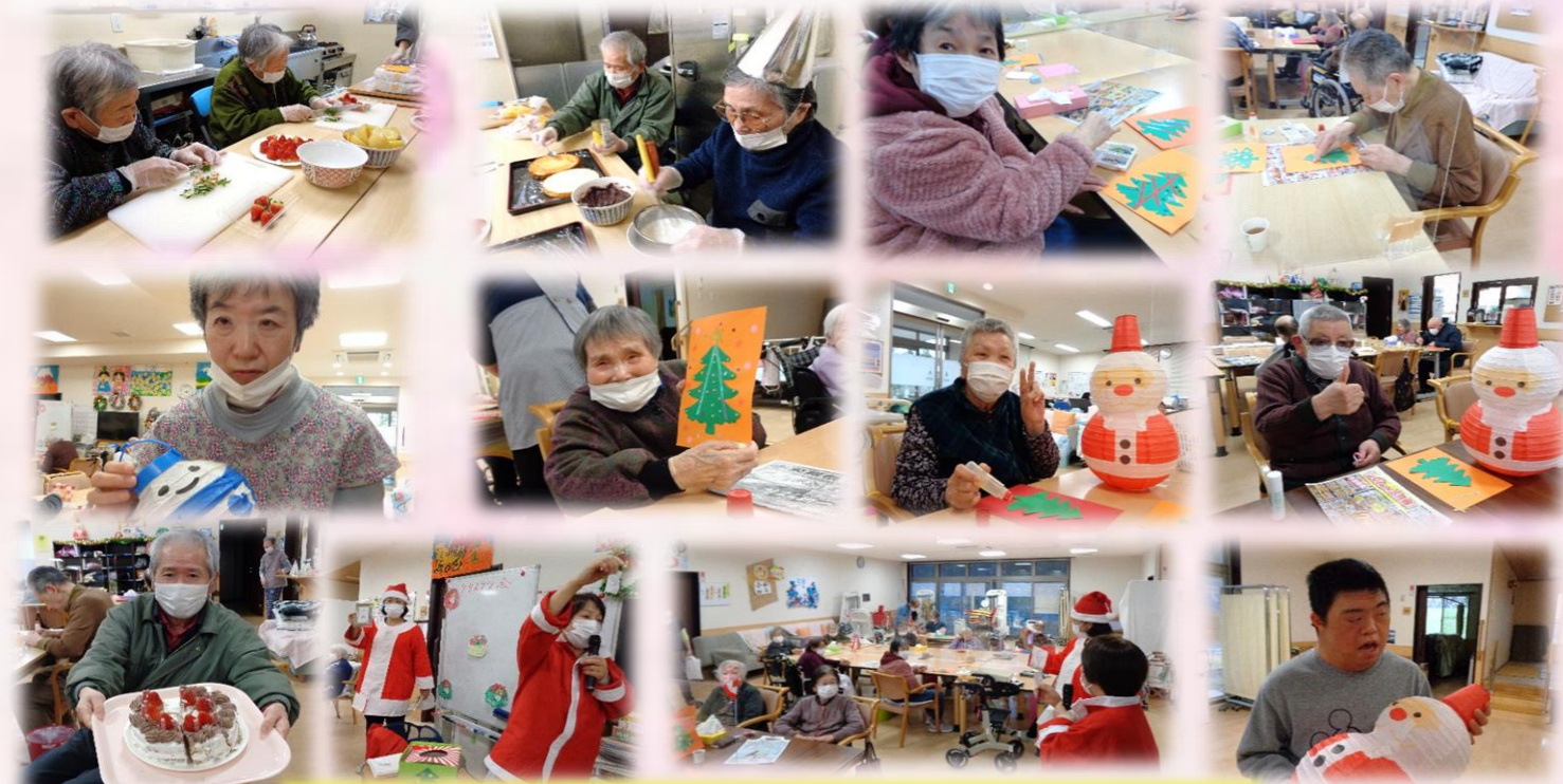
やわらぎサンタからのプレゼント抽選会もありました🎁

クリスマスにはケーキやツリーの壁掛けを作りました。ケーキはなんとあんこ入り。見た目も味も大好評でした。ツリーの壁掛けも個性豊かな作品が出来上がっていました。