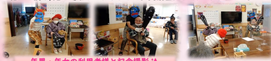
年男・年女の利用者様と記念撮影📷