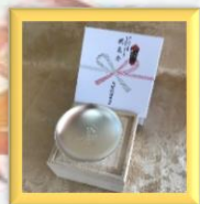
内閣総理大臣より

上記写真は「長寿を祝う会」で米寿と百寿を迎えた利用者様をお祝いしたものです。今年には二名の方が米寿、一名の方が百寿を迎えられ、大和町長より敬老祝い状が贈呈されました。園長が代読にて授与式を行い、誇らしい笑顔で受け取られています。また、その他にも百歳の利用者様には、内閣総理大臣から、多年にわたり社会の発展に寄与してきたことに感謝するとともに、広く国民が高齢者の福祉について関心と理解を深めることを目的とした、お祝い状及び記念品（銀杯）が贈呈されました。