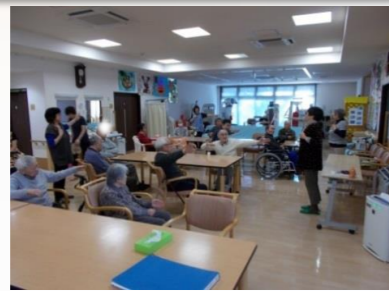
かたりべ (かぐや姫)