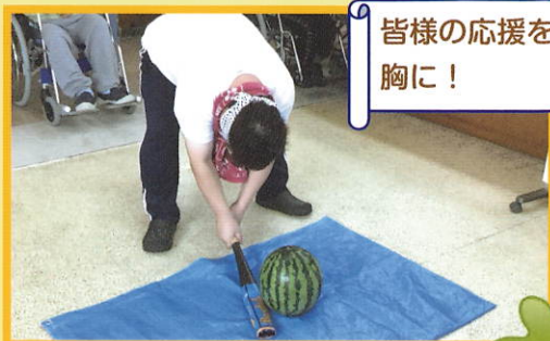
皆様の応援を胸に!