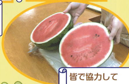
皆で協力して綺麗に割れました!