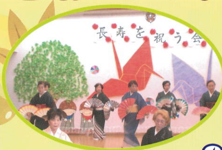
皆様おめでとうございます。これからもお元気でお過ごしください。