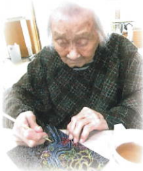
真心こめて作りました!