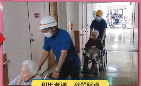
利用者様 避難誘導