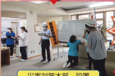
災害対策本部 設置