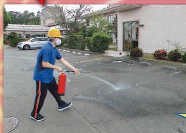
消火器訓練の様子