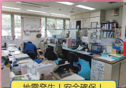
地震発生！安全確保！