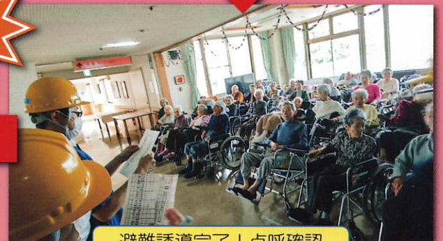
避難誘導完了！点呼確認