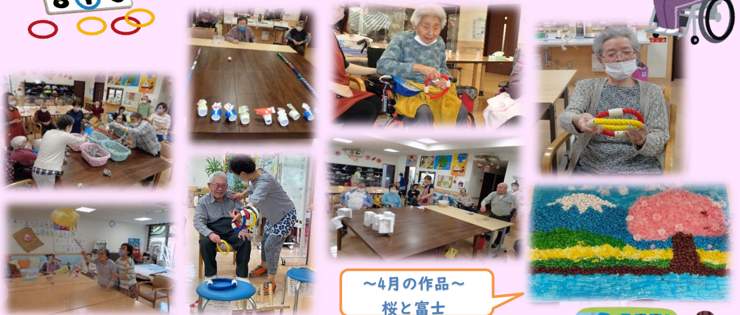
~4月の作品~ 桜と富士