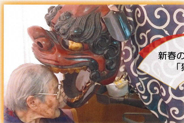
新春の集いの一幕 「獅子舞」