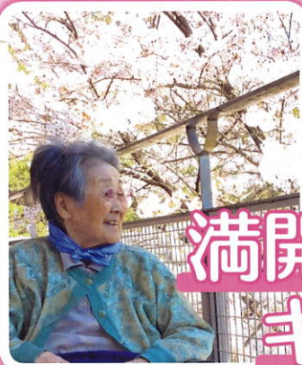
満開の桜 キレイだねえ