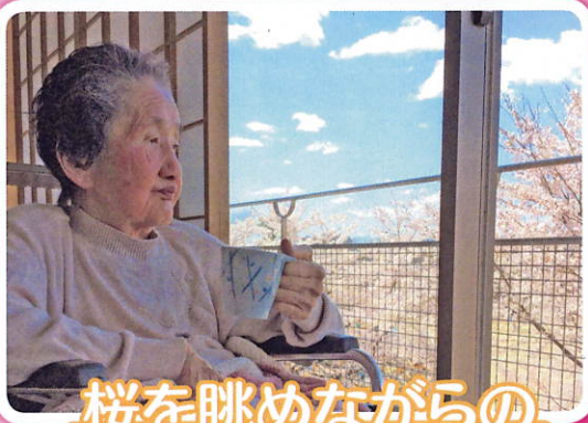
桜を眺めながらの ティータイム