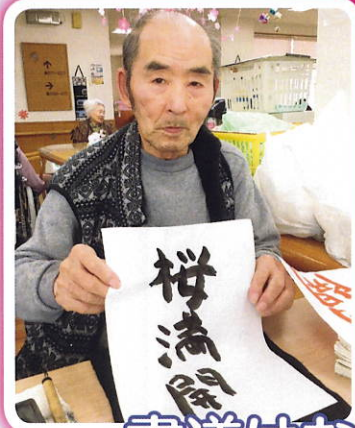
書道はお手のもの