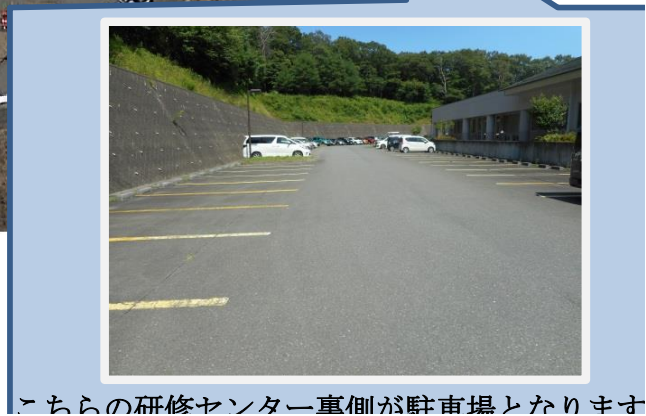
こちらの研修センター直側が駐車場となります