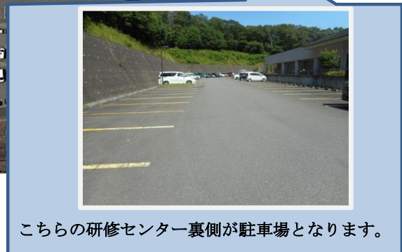
こちらの研修センター裏側が駐車場となります。