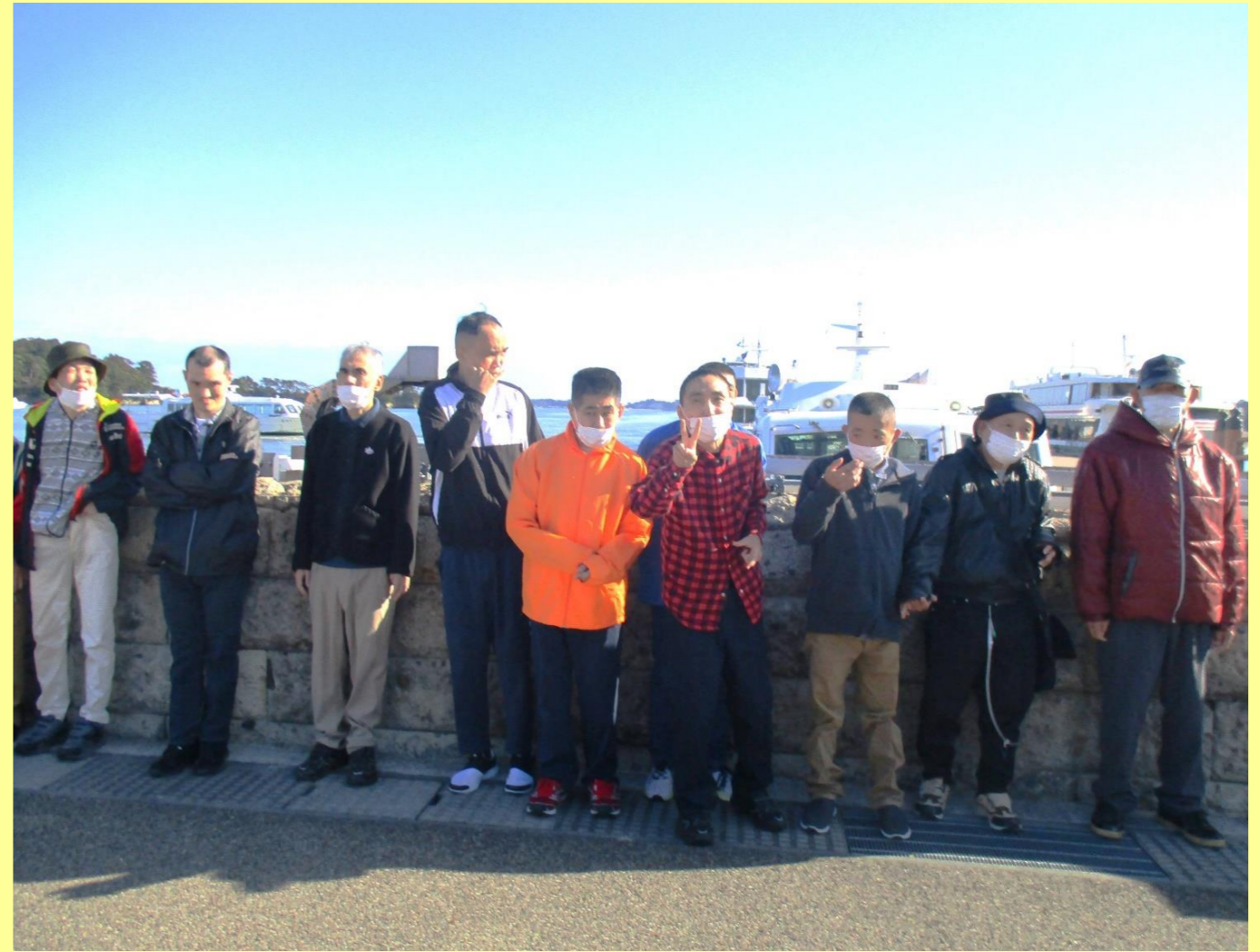
表紙写真：日帰り旅行の松島にて