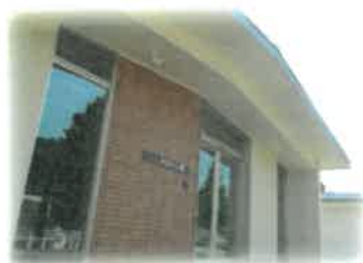
生活支援第四部 （はちくら園）