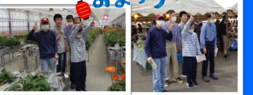
地域のイベントに参加