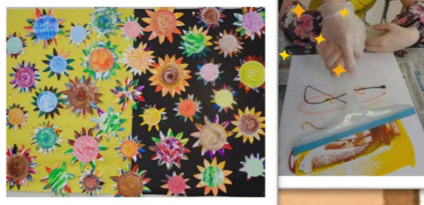
しんぼし 夏の芸術祭