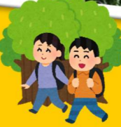
5月のドライブ外出 in セツ森