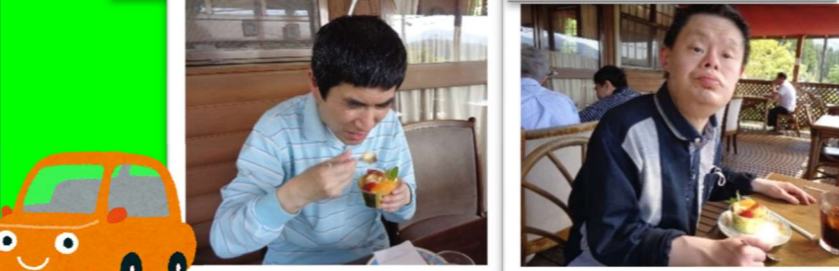
5月のドライブ外出 in 大和町