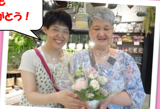
いつもありがとう!