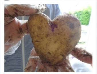
今年はたくさんの玉ねぎとじゃがいもを収穫しました!